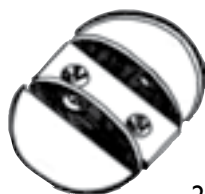
Réf. M19 28 x 25 x 50 mm