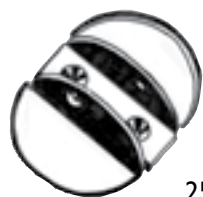
Réf. M16 25 x 25 x 50 mm