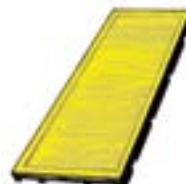
Réf. KP44-4 44 x 100 x 4 mm Jaune