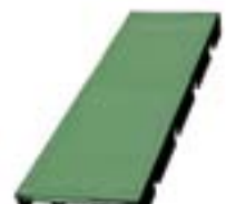
Réf. KP44-5 44 x 100 x 5 mm Vert