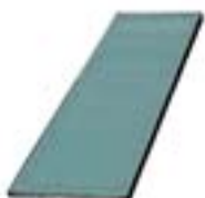
Réf. KP44-2 44 x 100 x 2 mm Gris