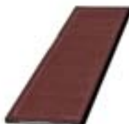
Réf. KP44-3 44 x 100 x 3 mm Bordeaux