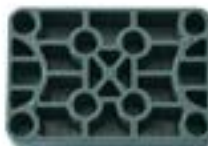
Réf. KGP6415 60 x 40 x 15 mm Gris