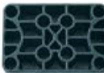
Réf. KNP6420 60 x 40 x 20 mm Noir