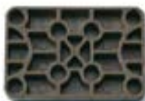
Réf. KMP6410 60 x 40 x 10 mm Marron