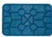
Réf. KBP6402 60 x 40 x 2 mm Bleu