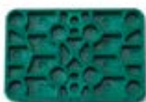
Réf. KVP6405 60 x 40 x 5 mm Vert