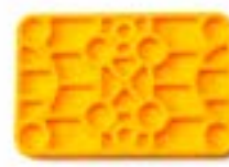
Réf. KOP6404 60 x 40 x 4 mm Orange