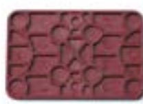
Réf. KRP6403 60 x 40 x 3 mm Rouge