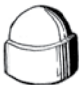
Réf.: 10CE pour clé de 10 Hauteur 13 mm