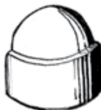
Réf.: 13CE pour clé de 13 Hauteur 16 mm